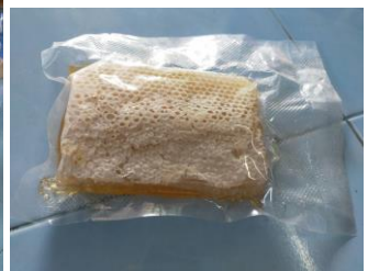
***ใส่ภาพประกอบ พร้อมนำข้อมูลขึ้นเผยแพร่บนเว็บไซต์ เช่น สำนักงานปศุสัตว์จังหวัดหรือสำนักงานปศุสัตว์เขต เป็นต้น***